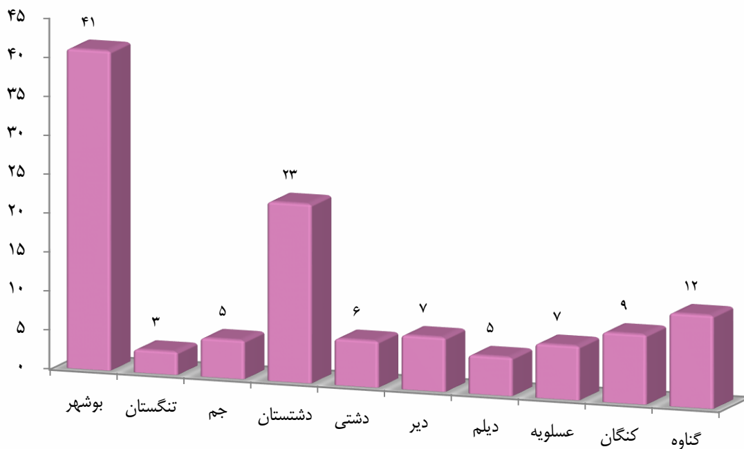
نمودار ۹-۱. مقایسه داروخانه‌های فعال استان بوشهر به تفکیک شهرستان سال ۱۳۹۶